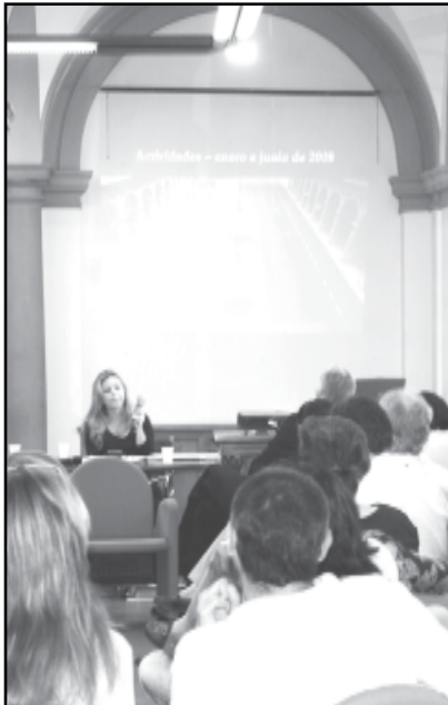
Encontro avalia os resultados dos módulos de capacitação implantados pelas cidades sócias

ça a ser vencido e entre os seus muitos resultados teremos uma nova política pública, baseada na cooperação entre a administração municipal e a sociedade”, ressaltou Zalewski.