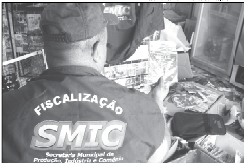
Neste ano foram recolhidos 96.488 itens, número bem inferior aos mais de 653 mil apreendidos durante o ano passado

Segundo Correa, a redução do comércio ilegal se deve à constante fiscalização da Smic, que realiza o controle diário no centro e nos demais locais onde há venda de tênis, óculos, CDs e DVDs falsificados. Outra prática combatida pela ação é o comércio de bebidas alcoólicas e alimentos sem inspeção, nas proximidades dos estádios de futebol e locais