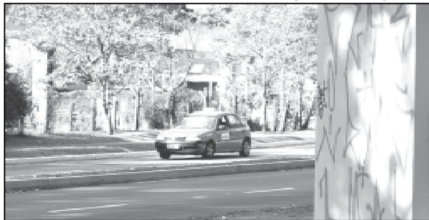
Taxistas irão denunciar atos de vandalismo