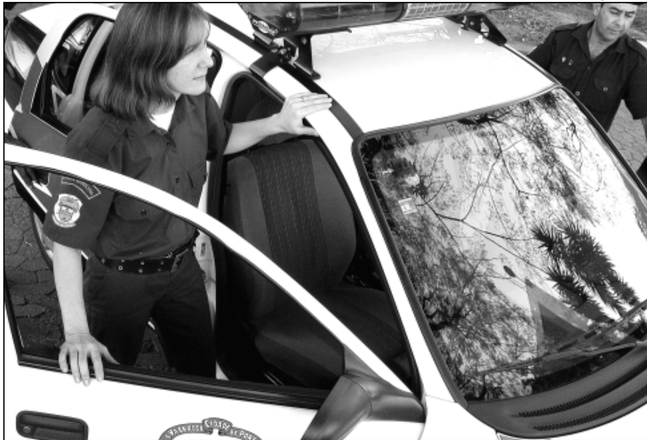
Agentes da Guarda Municipal serão designados para trabalhar no parque