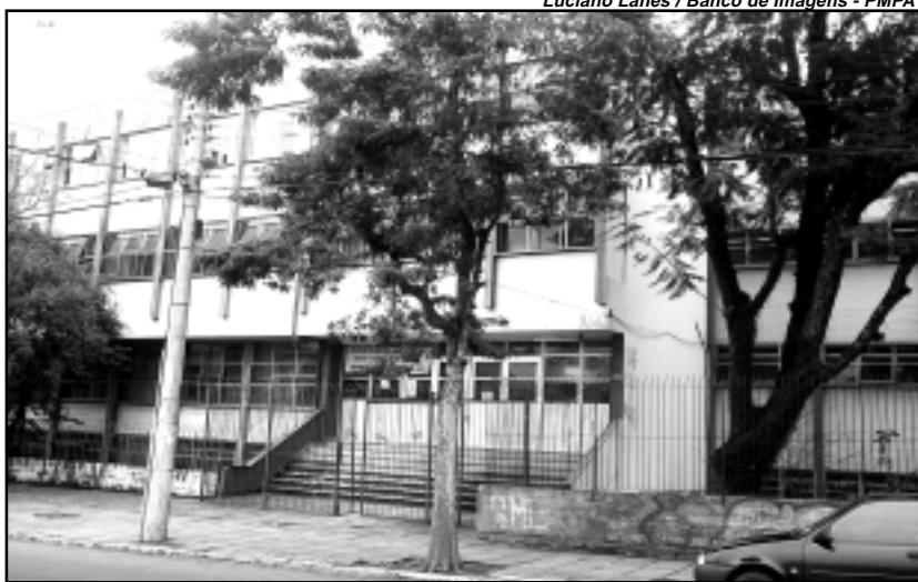
Escola possui 60 professores, 14 funcionários e 1,2 mil alunos

Atualmente, a Emílio Meyer possui 60 professores, 14 funcionários e 1,2 mil alunos, distribuídos em cursos de Ensino Médio, Curso Normal para Educadores Populares e Técnicos em Contabilidade, todos em horário noturno. Além dos cursos, a escola oferece durante à tarde, das 14h às 17h30, oficinas gratuitas abertas à comunidade nas áreas de desenho, teatro, música, cerâmica, informática e violão.