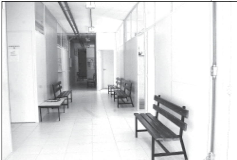
Centro de Saúde recebeu R$ 86 mil de investimentos

• Grupo de Asma Adulto e adolescente - Atendimento