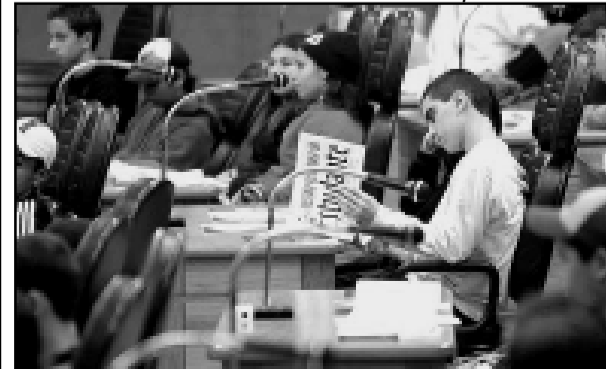
Alunos apresentaram projetos em sessão simulada