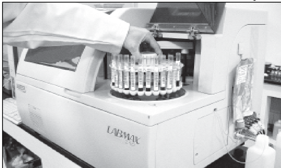
Laboratório Central de Análises Clínicas já realizou mais de 200 mil exames