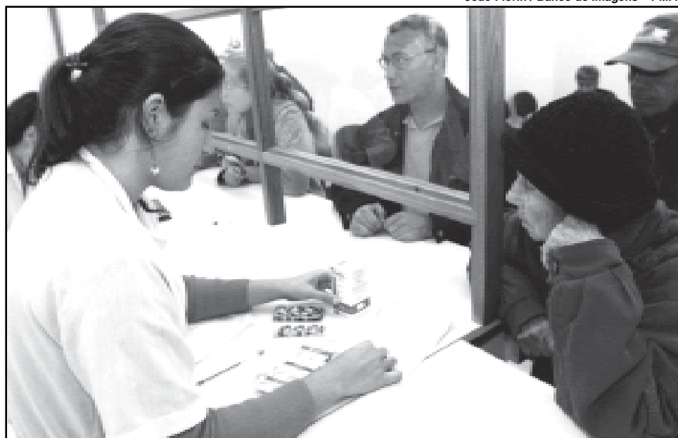
Programa de Saúde da Família é uma ação vinculada ao Receita é Saúde