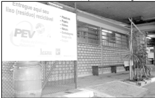
Um dos postos de coleta está instalado na Av. Silva Só, sob a elevada Tiradentes (esquina Protásio Alves)