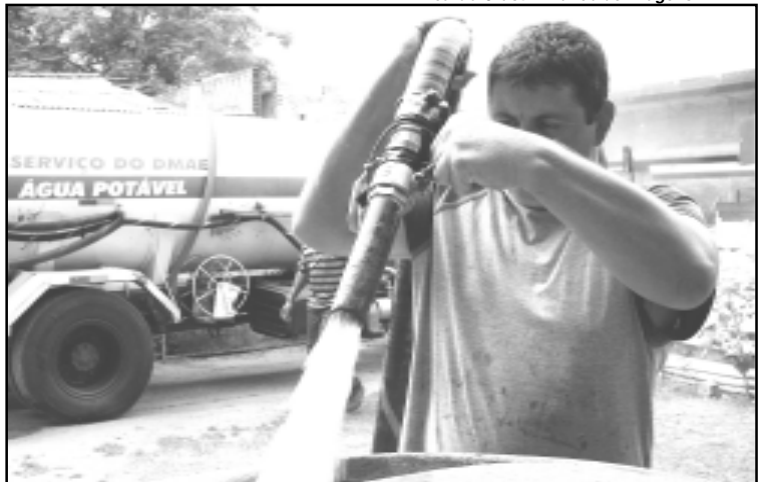
Abastecimento nas ilhas deixará de ser feito por caminhões-pipa