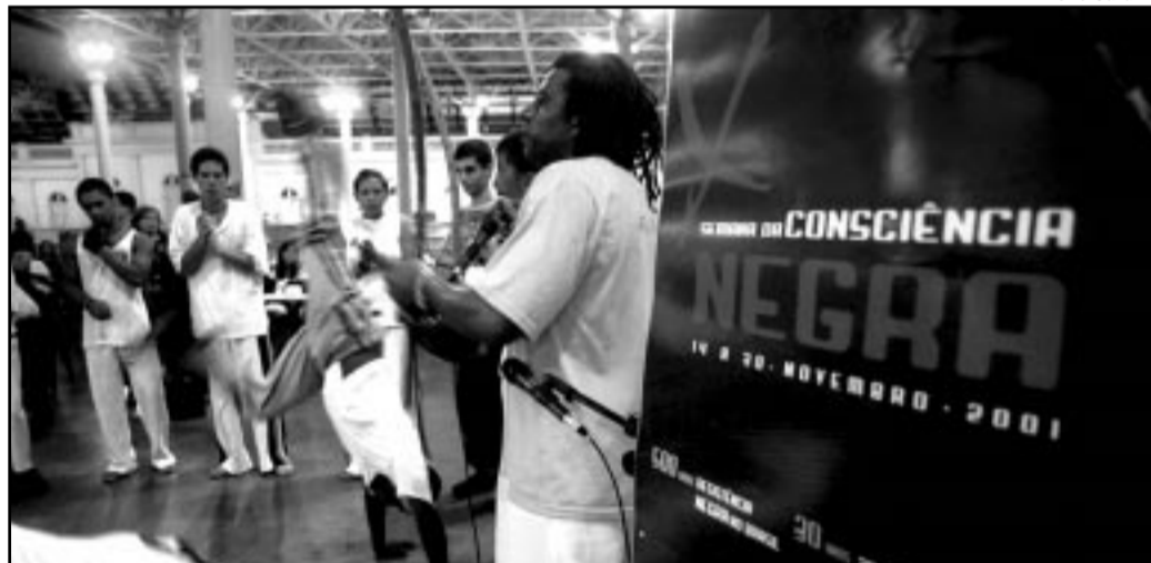
Debate tem presença de ministra de Políticas de Promoção da Igualdade Racial