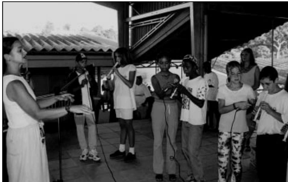
Exposição de 10 mil alunos fica até 4 de dezembro