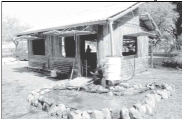
Piquete ficará aberto até o dia 20 de setembro, das 14h às 21h