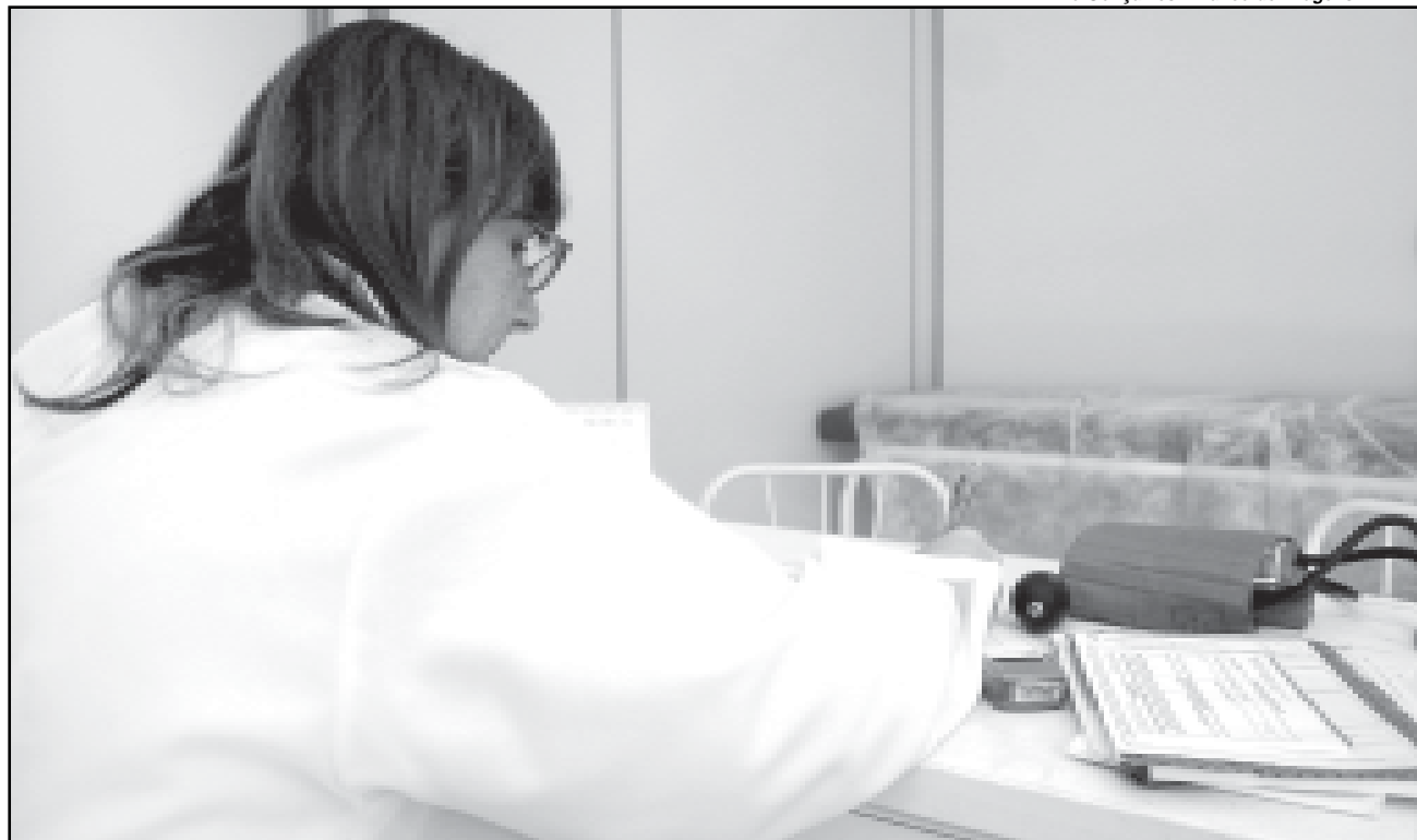
Acordo permite preservação e continuidade dos serviços