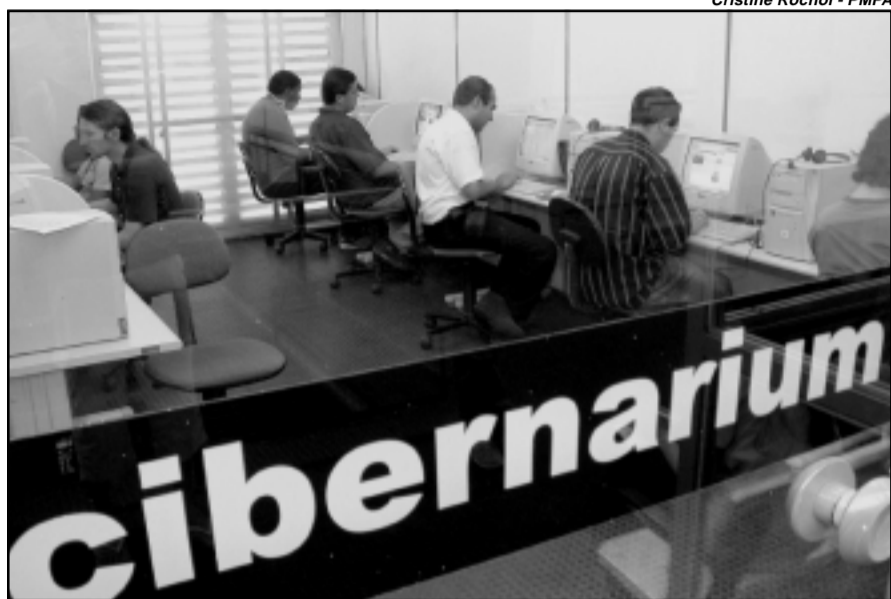
Cristine Rochol - PMPA

Braile no ambiente de formação do Cibernarium (quarto andar da Usina do Gasômetro). O espaço destinado aos deficientes visuais possui cinco computadores equipa-