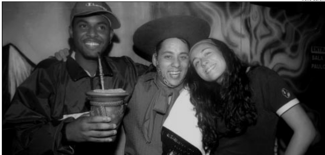
Sobrevivência das identidades locais diante da globalização preocupa organizadores