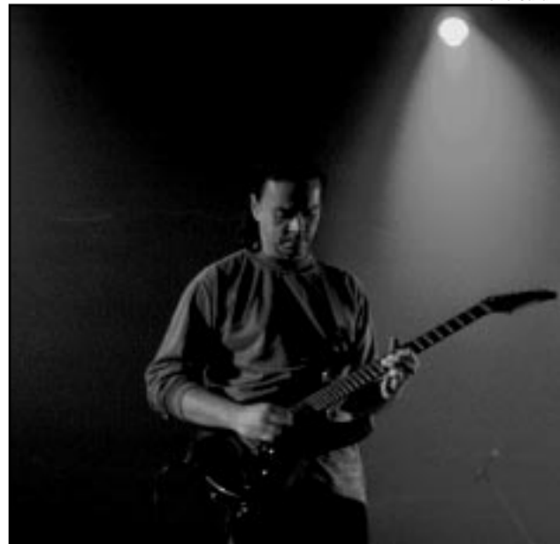
Objetivo é renovar temas musicais que homenageiam a Capital