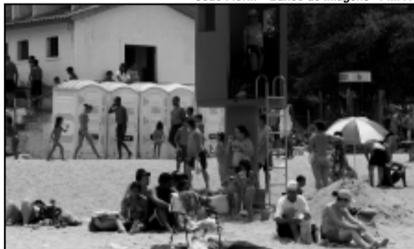
Todos os pontos da praia do Lami estão liberados para banho

Com base nas informações da análise de balneabilidade realizada pelo Departamento Municipal de Água e Esgotos (Dmae), a Secretaria Municipal do Meio Ambiente (Smam) liberou para banho, neste final de semana (dias 14 e 15), todos os pontos do Lami. Em Belém Novo, apenas o posto 3 (Veludo) está impróprio.