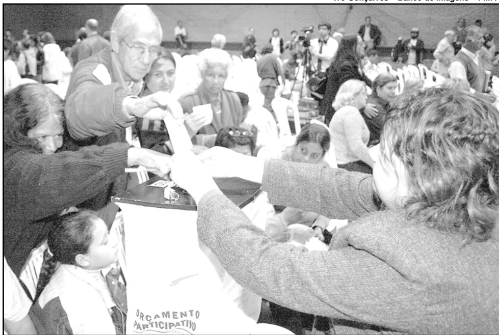
Participaram até agora 14.187 pessoas, um acréscimo de 22.61%, em relação ao ciclo passado

é quando o fórum de delegados das regiões e temáticas entrega ao prefeito a relação, por ordem de importância, das obras e dos serviços eleitos pela população para execução a partir do ano seguinte. É também neste momento que os conselheiros eleitos, num total de 96 (92, das 17 regiões e seis temáticas, 2 do Sindicato dos Municipários e 2 da União das Associações de Moradores de Porto Alegre) serão empossados para a gestão 2007/2008