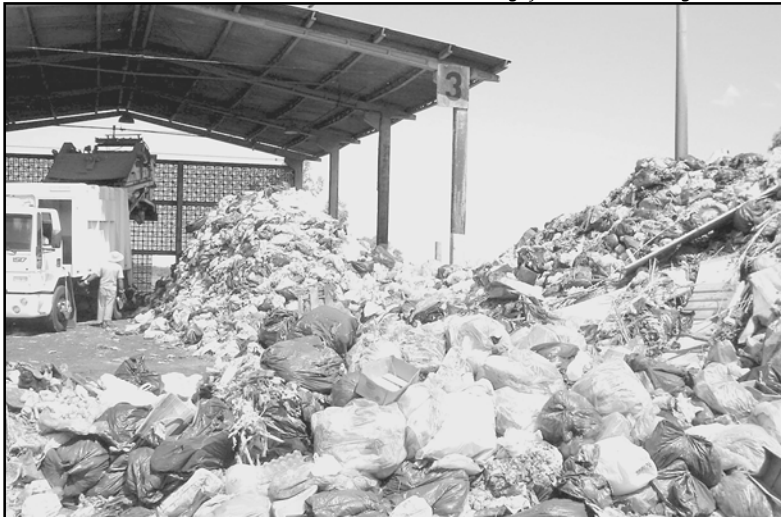
O projeto levará em conta as características e objetivos de cada município, bem como questões ambientais