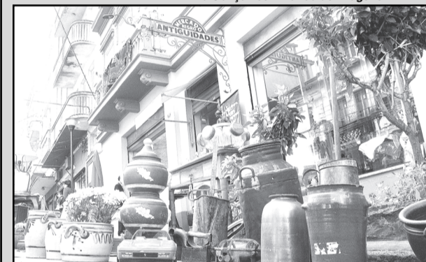
Caminhos dos Antiquários