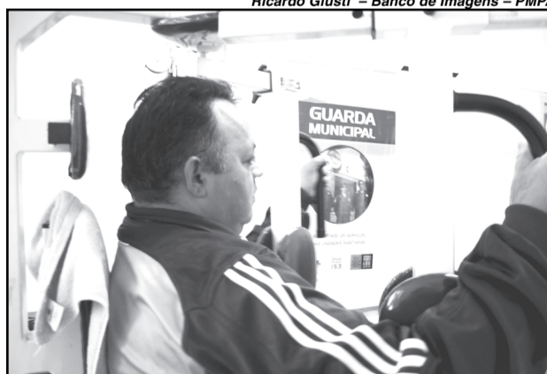
Agentes da Guarda praticam atividades físicas com acompanhamento de saúde

Reduzir os afastamentos — Na próxima terça-feira, a primeira atividade do Em Guarda pela Saúde será desenvolvida pela Escola Profissional do Instituto de Cardiologia. Os profissionais da saúde farão exames de verificação de pressão arterial, medição de peso, Índice de Massa Corpórea e Índice de Glicose.