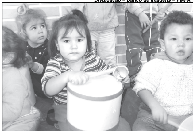
Alunos de 2 a 6 anos da Escola Vila Elizabeth constroem seus instrumentos