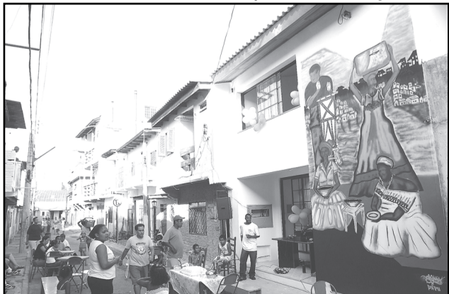
A comunidade do Areal da Baronesa é um dos quatro quilombos de Porto Alegre