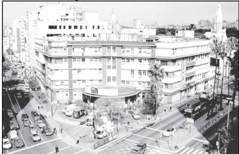
Dezoito profissionais trabalham no apoio, proteção e defesa dos usuários do HPS que sofrem injustiças sociais