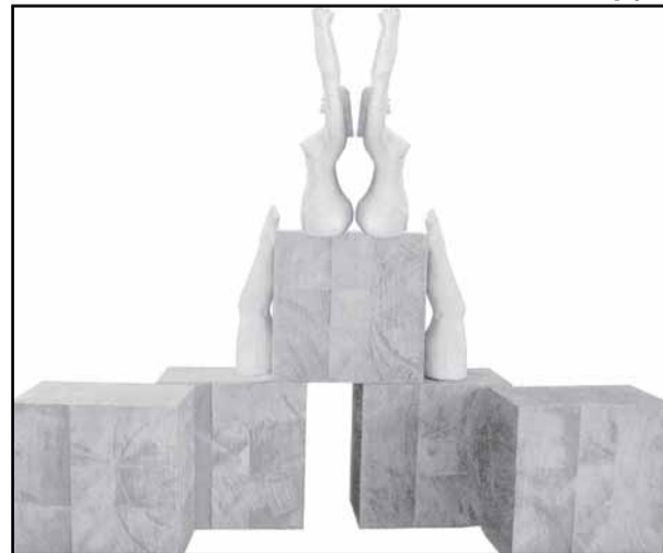
Artista cria esculturas em cerâmica

Textos elaborados e de responsabilidade da Assessoria de Comunicação da Câmara