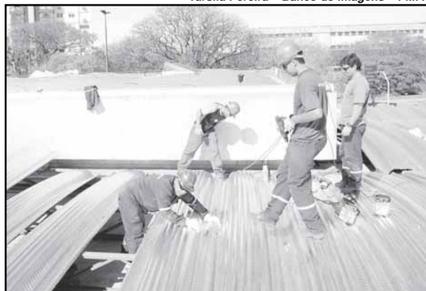
Telhado está sendo totalmente reestruturado