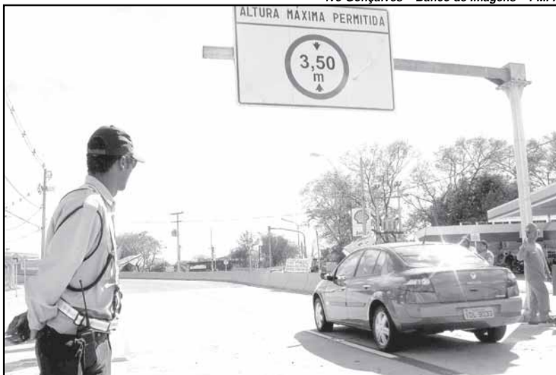
Atividades de educação e obras de qualificação das vias têm contribuído para um trânsito mais harmonioso

O secretário municipal de Mobilidade Urbana destaca o avanço nas relações entre motoristas e pedestres. “As obras de qualificação das vias e diversas ações da prefeitura em engenharia de tráfego e transporte, além das constantes atividades de educação, têm contribuído para um trânsito mais harmonioso”, avalia. “Ao contrário da maioria das capitais brasi-