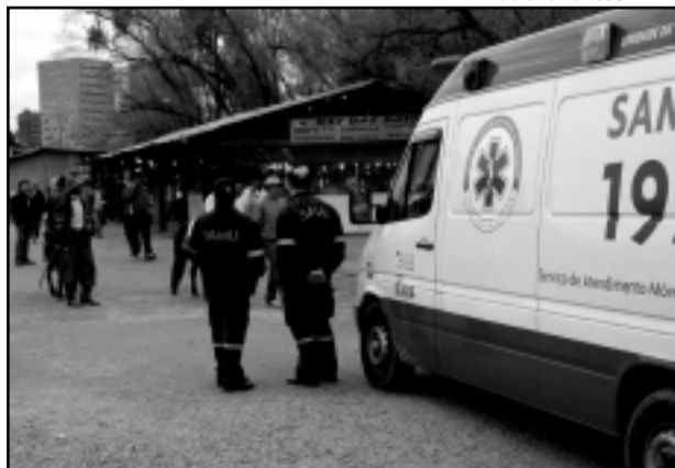
A estrutura de atendimento de saúde está montada desde o dia 27 e conta com um ambulatório e uma ambulância básica