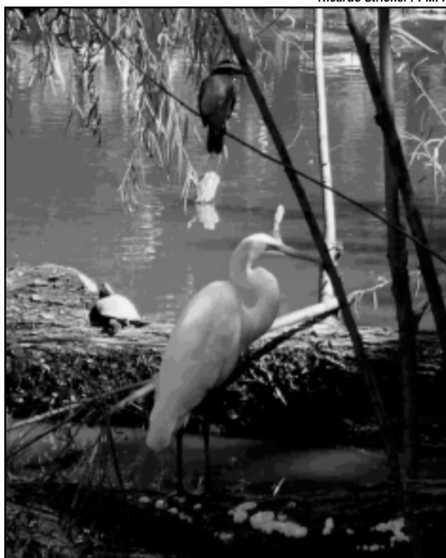
A preservação e a consciência ecológica está no foco da programação do mês da primavera