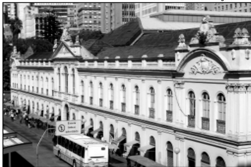
Feira no Mercado terá participação de 29 artesãs