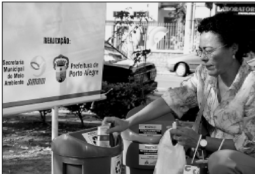
Comunidade recebeu instruções sobre a correta destinação dos medicamentos

Durante o evento, a comunidade recebeu instruções de como proceder com os medicamentos vencidos; também houve uma intervenção artística do Serviço de Assessoria Socioambiental do DMLU (SASA). Além de incentivar a população ao descarte de medicamentos fora do prazo de validade, o projeto tem o objetivo de conscientizar a comunidade sobre a importância de adotar um destino ambientalmente correto para os produtos. A campanha visa ainda formar uma consciência ecológica direcionada à adoção da coleta seletiva e reciclagem do lixo.