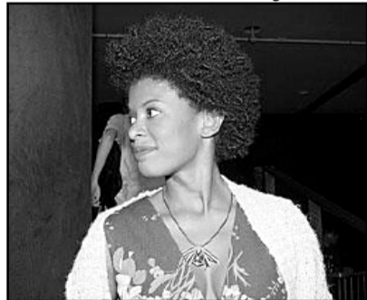
Talma de Freitas é uma das estrelas do filme