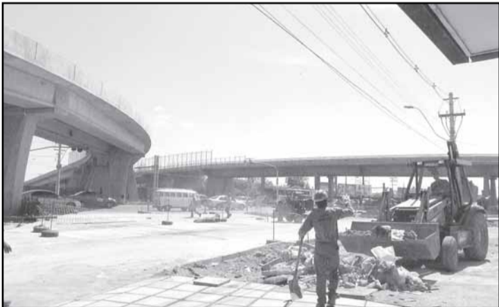
Entre as melhorias de infra-estrutura está o recém concluído viaduto Leonel Brizola, que facilita o acesso ao Bairro Humaitá