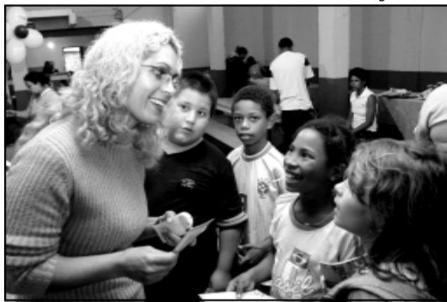
Uma das ações é a instalação da creche comunitária para o atendimento de 130 crianças

As outras localidades que já realizaram o Cuidando da Cidade foram: Ilha da Pintada, 4 de agosto, Glória e Ascensão, em 12 de agosto, e nesta segunda-feira, 14, a visita foi na Vila Ipê-