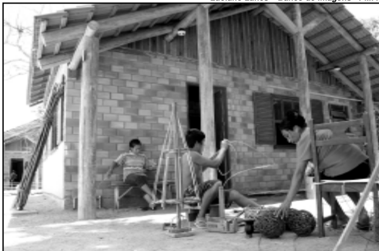
A área tem seis hectares, 23 casas, centro cultural, escola bilíngüe, centro de saúde e centro fitoterápico

O projeto resulta de convênio da Prefeitura com a ONG espanhola Fundación Paz y Solidaridad . A área foi conquistada pelos índios no Orçamento Participativo (OP) de 2000. As obras das moradias foram iniciadas em outubro de 2005 com a coordenação da Secretaria Municipal de Direitos Humanos e Segurança Urbana (SMDHSU) em parceria com o Departamento Municipal de Habitação (Demhab).