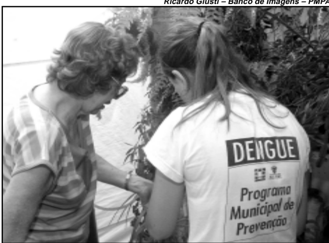
A redução se deve ao intenso trabalho de vistorias domiciliares realizadas pelos agentes de saúde

O valor médio do Índice de Infestação Predial para o Aedes aegypti obtido no mês de novembro é de 0,43%, uma redução de 90% em relação ao número obtido em maio, que foi de 4,46%. O número de bairros com a presença do vetor diminuiu, assim como a densidade larvária. Nos bairros Jardim Carvalho e Jardim do Salso, em maio, o IIP era de 17,9, hoje