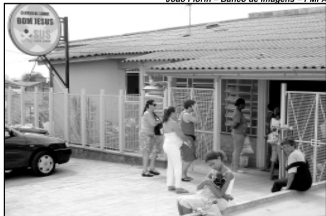
As festividades comemoram também a aprovação dos serviços, atestada em pesquisa realizada com os usuários

usuários. No ambulatório do Bom Jesus, a facilidade para agendamento foi considerada ótima ou boa para 74,2% das pessoas pesquisadas. O atendimento de enfermagem é ótimo ou bom para 88,3% dos entrevistados e, na recepção, o índice de aprovação foi de 75%. O trabalho dos médicos também foi ótimo ou bom para 81,4% dos participantes da pesquisa.