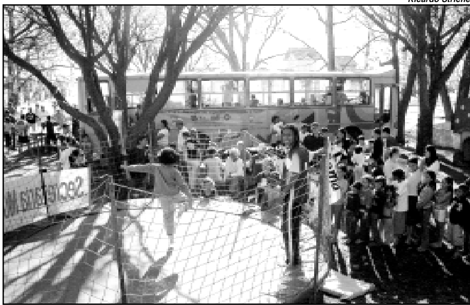
O brincalhão estará em três eventos no fim de semana

Outro evento será o XVI Campeonato Municipal de