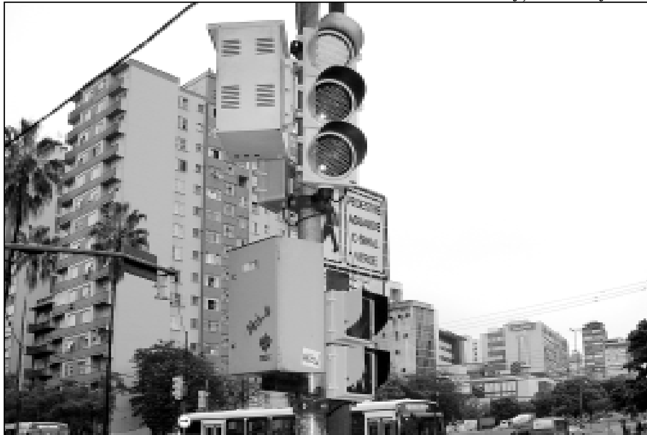
Este tipo de semáforo garante mais economia e proporciona boa visibilidade