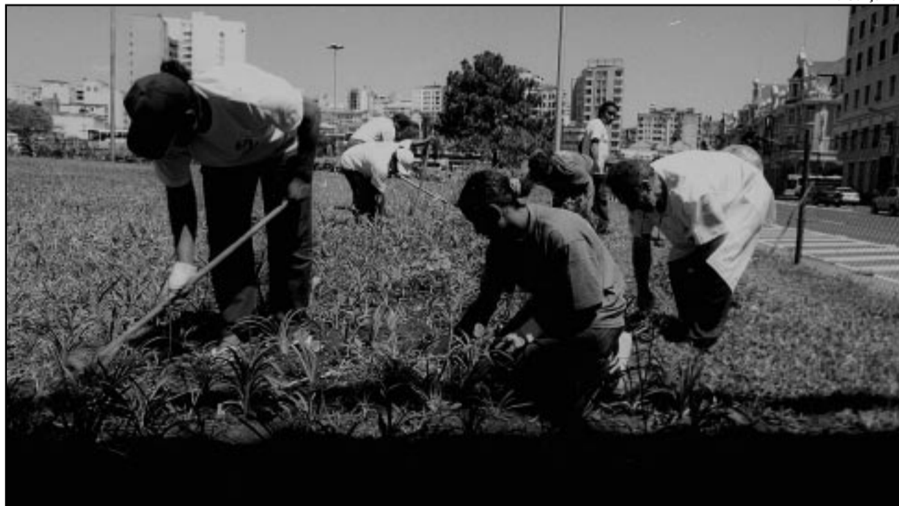
Técnicas como a jardinagem permitem aos adolescentes obter renda