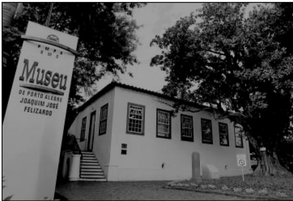
Instituição mantém as atividades normais, como exposições, cursos e oficinas

O museu conta com um grande acervo de utensílios, fragmentos arqueológicos e peças antigas. Abriga uma fototeca na qual podem ser encontrados registros fotográficos que retratam Porto Alegre em diferentes épocas desde o século 19, e uma biblioteca que guarda obras de referência sobre a história de Porto Alegre.