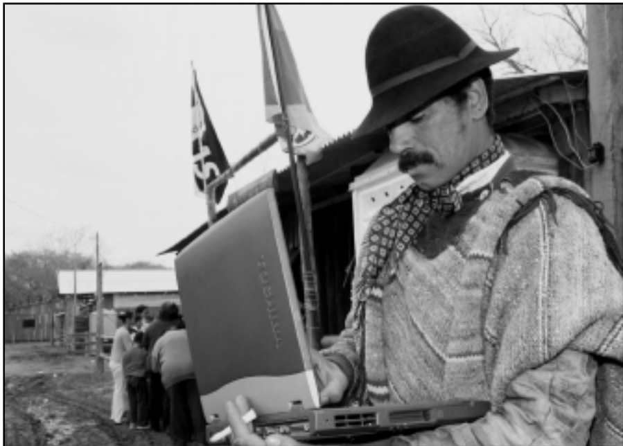
Quatro computadores e uma Rede Wireless (sem fio) oferece acesso gratuito à internet

A implantação da tecnologia na festa campeira foi possível, porque a empresa conectou ao parque no início do ano a sua Infovia, o anel de fibras ópticas que transporta dados, voz e imagens em velocidade mais de mil vezes superior à da linha discada. A rede cresceu dez quilômetros para possibilitar aos mais de 90 mil participantes do Fórum Social Mundial 2005 a comunicação com o mundo em plena Orla do Guaíba. O local, totalmente desprovido de qualquer infra-estrutura, ganhou mil pontos de rede, 14 pontos de transmissão de dados via rádio, dois pontos de acesso sem fio à Internet e 31 ciberespaços.