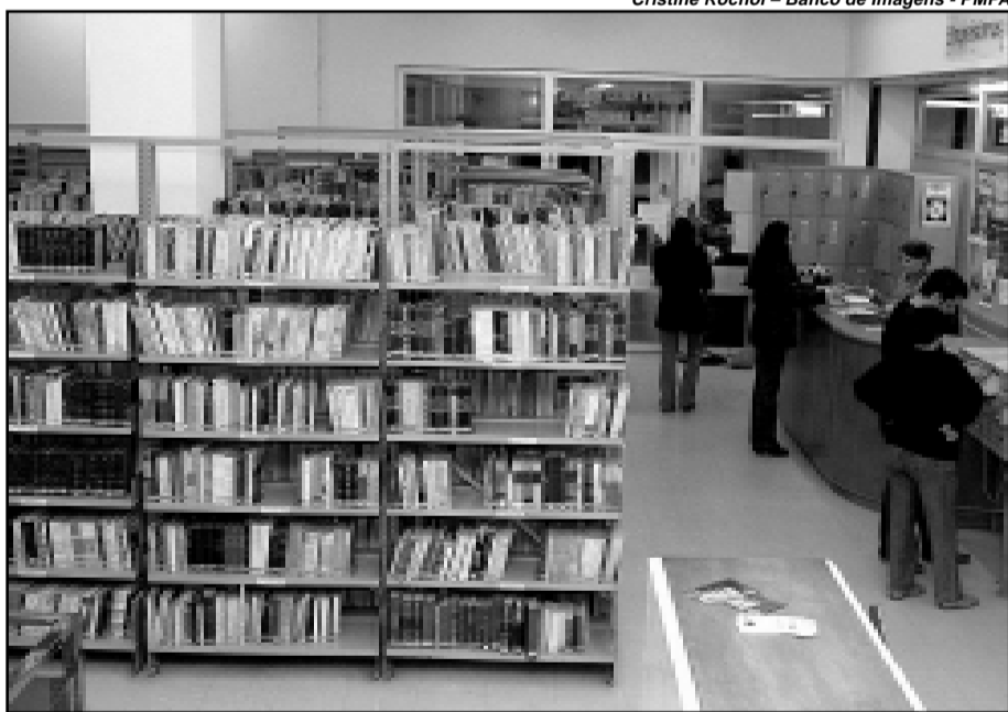
Biblioteca Municipal é palco de atividades de estímulo à leitura

A Biblioteca Pública Municipal Josué Guimarães integra a Coordenação do Livro e Literatura da Secretaria Municipal da Cultura (SMC) e oferece ao público serviços de empréstimo e consulta de livros e periódicos. Também coloca à disposição de seus leitores um acervo de CDs e fitas VHS, para empréstimo. Conta com cerca de 44 mil volumes e 14 mil associados e localiza-se no Centro Municipal de Cultura (Avenida Érico Veríssimo, 307). Mais informações podem ser obtidas pelo telefone (51) 3221-6622, ramal 216.