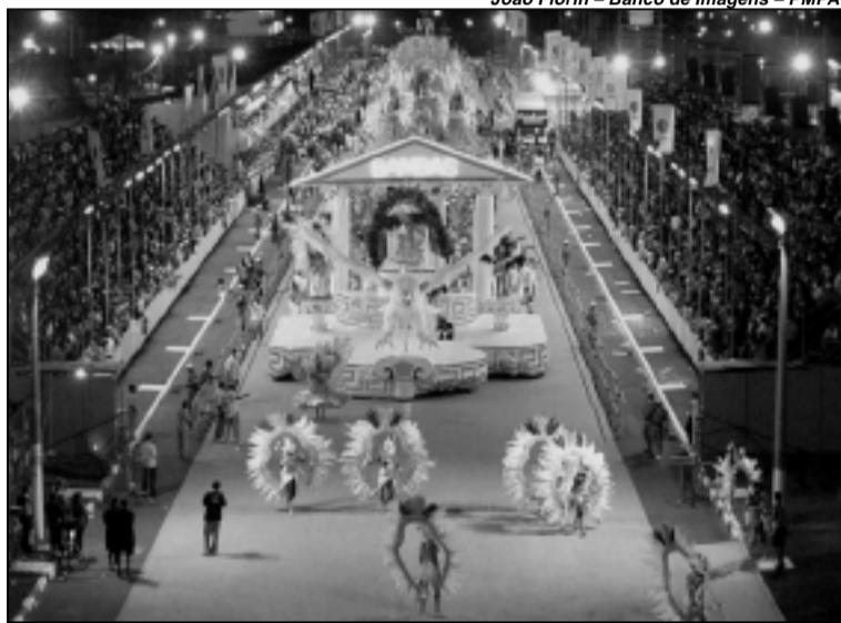
Os recursos arrecadados nos desfiles serão direcionados para as Escolas de samba

A Prefeitura de Porto Alegre informou que os recursos captados com o leilão de camarotes e venda de ingressos para assistir os desfiles de carnaval no Complexo Cultural Porto Seco, serão direcionados para as escolas de samba que desfilam em Porto Alegre. Os recursos, estimados em 200 mil reais, serão destinados para a premiação das entidades, visando qualificar o espetáculo.