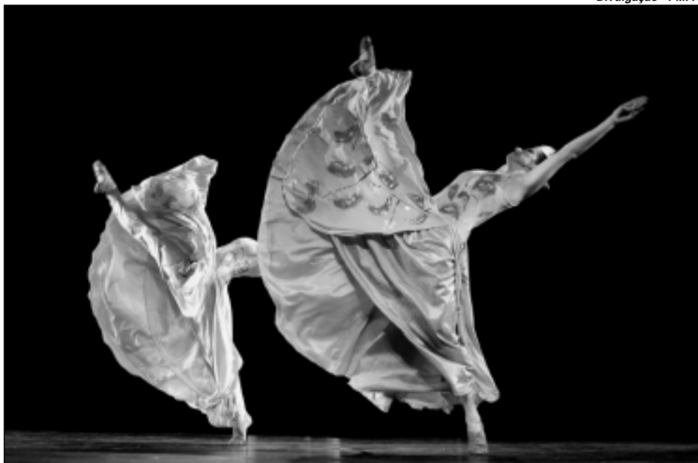
Uma das mais encantadoras histórias de Natal immortalizadas no balé que ganha nova versão

Encenado em dois atos, o balé conta a fantasia de Clara, uma garota que, na noite de Natal, ganha muitos presentes, mas se encanta de uma maneira especial por um deles, um boneco quebra-nozes. Quando todos vão dormir, Clara vai à sala para brincar com seu novo presente, adormece e entra no mundo da fantasia. Os brinquedos ganham vida, dan-