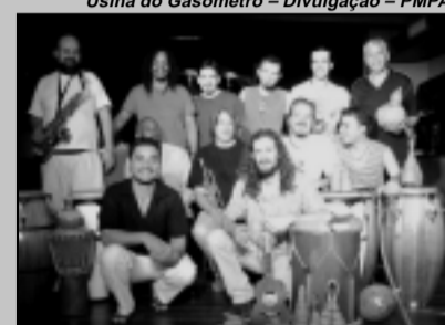
Usina do Gasômetro

O grupo Serrote Preto apresenta no próximo domingo, 18, às 20h, no terraço da Usina do Gasômetro (Avenida Presidente João Goulart, 551), o show "Aviso aos Navegantes", com entrada franca. A