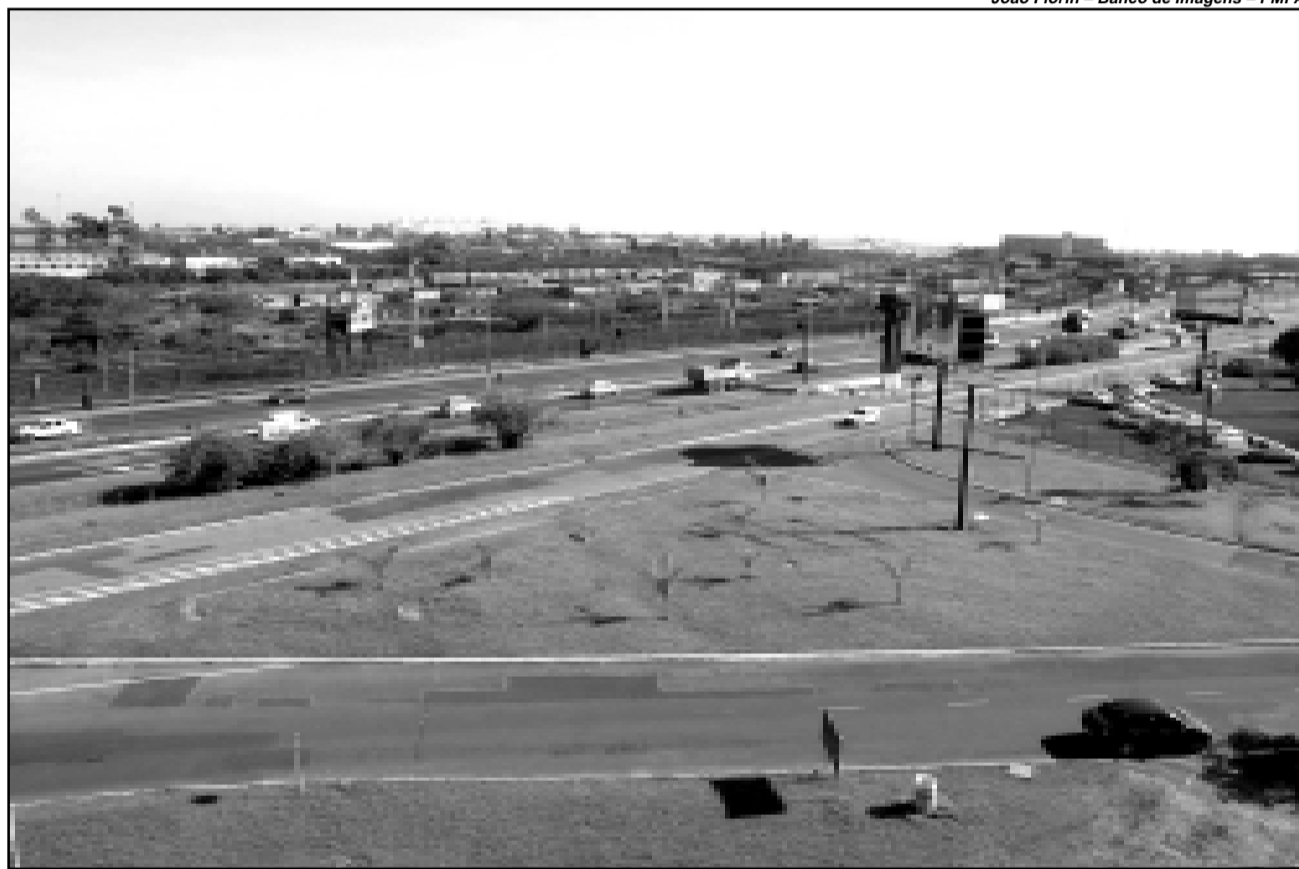
Área onde será instalado o novo Sítio do Laçador