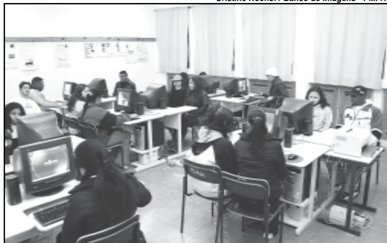
Jovens têm acesso à inclusão digital e cursos de qualificação