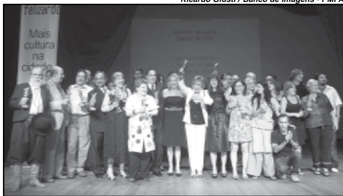
Prêmio reconhece 20 destaques de diferentes áreas