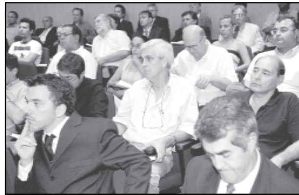
Entidades lotaram Teatro Glênio Peres