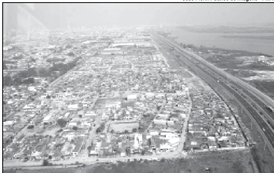
Piec vai garantir 3061 moradias para famílias em situação de risco