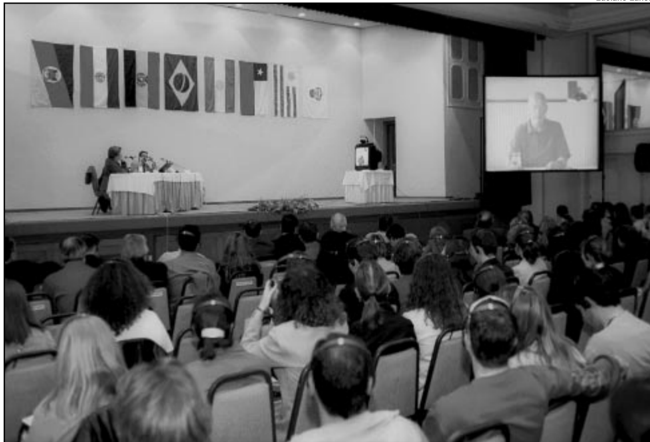
Edição anterior do evento reuniu 1.200 participantes na Capital, em 2002