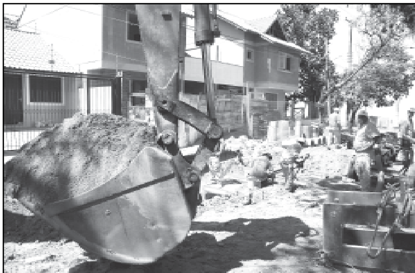
Serão investidos R$ 20 milhões nas três obras e no plano de drenagem, mais 15% como contrapartida da prefeitura

As obras serão executadas na Rua Santa Terezinha (Bairro Santana), com investimento de R$ 5,5 milhões na construção da casa de bombas Santa Terezinha e na execução de novas redes e galerias pluviais; na Avenida São Pedro (Bairro São Geraldo), com investimento de R$ 6,3 milhões na execução de redes e galerias pluviais no leito da via; e na Avenida Buarque de Macedo (Bairro São Geraldo), com investimento de R$ 1,6 milhão na implantação de