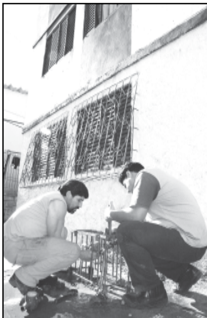
No ano passado, foram instalados 1,7 mil novos hidrômetros