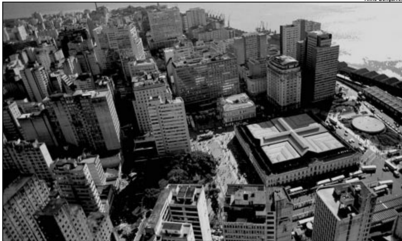
Termo de cooperação prevê ações dirigidas à área central da cidade