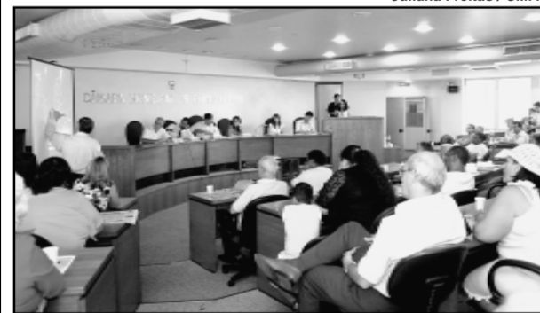
Dragagem é uma das soluções para alagamentos