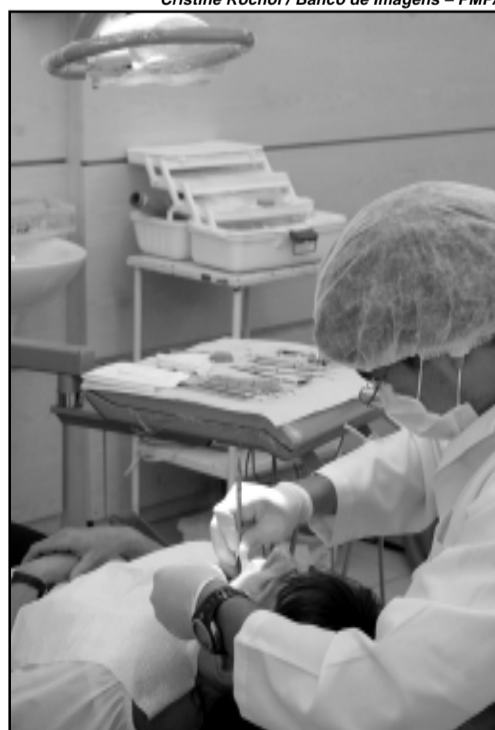
Programação prevê ações como serviço odontológico

Ao longo do dia ocorrerão atividades culturais e esportivas como a apresentação do trio elétrico do Grupo Reprise Produções, o Ônibus Brincalhão, cama elástica, trupe de humoristas da Rede da Solidária, banda do Colégio Itamarati, banda da Brigada Militar, Coral da Fasc, show Música Jovem - cover dos Rebeldes, Calipso e grupo de Pagode, além de apresentação dos CTGs Rubem Berta e Coxilha Aberta e desfile de grupo de idosos.