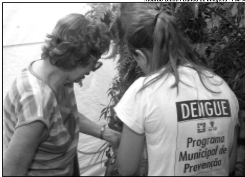
Agentes de saúde estarão orientando sobre o mosquito Aedes Aegypti