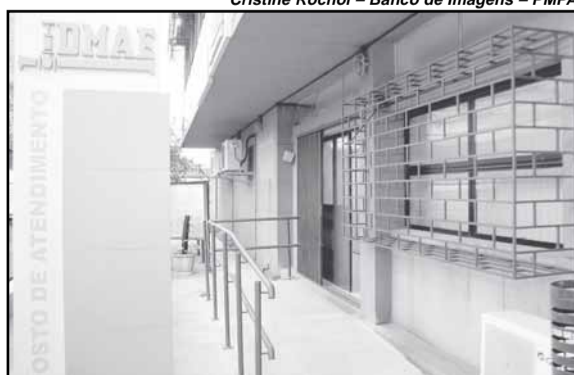
O novo posto funcionará de segunda a sexta-feira, exceto feriados, das 8h30 às 16h30, sem fechar ao meio-dia

Para criar o novo espaço, o Dmae investiu cerca de R$ 108 mil nas obras iniciadas em junho. Desde o ano passado, o Dmae reformou e qualificou os postos comerciais do Centro, da Zona Norte e do bairro Partenon. Atualmente, o posto da Azenha (Rua Barão do Triunfo, n.º 714) está em reformas, com previsão de reabertura em outubro.