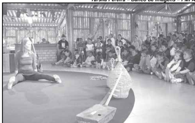
A peça dinamarquesa Zé Malandro e a Morte é um dos destaques