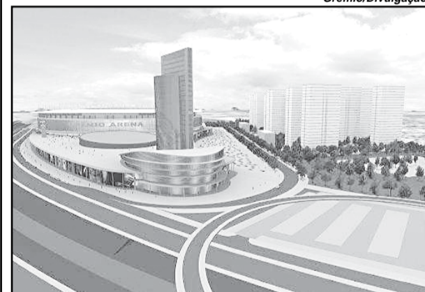
Perspectiva artística da Arena do Grêmio