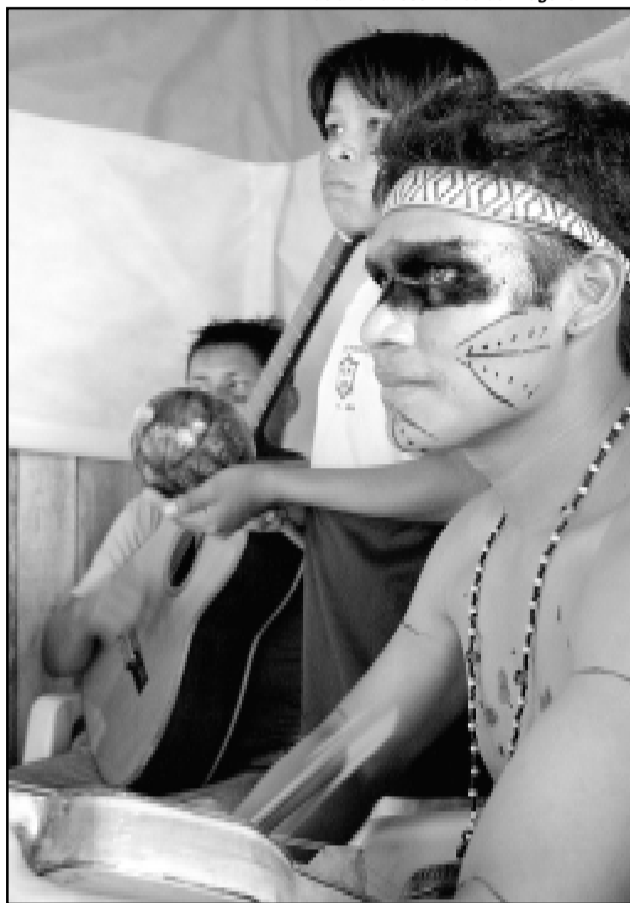
Seminário vai discutir a questão indígena no estado

No dia 25 de abril, será realizado na Câmara Municipal o seminário "A Questão Indígena no Rio Grande do Sul". A antropóloga que coordenadora o Núcleo de Políticas Públicas para os Povos Indígenas será responsável pelo painel sobre a realidade dos povos indígenas na Capital. Domingo, 29, junto ao Monumento ao Expedicionário (Parque Farroupilha), acontece o Brique Comemorativo - Mês dos Povos Indígenas. Caingangues, Guaranis e Charruas participam da programação.