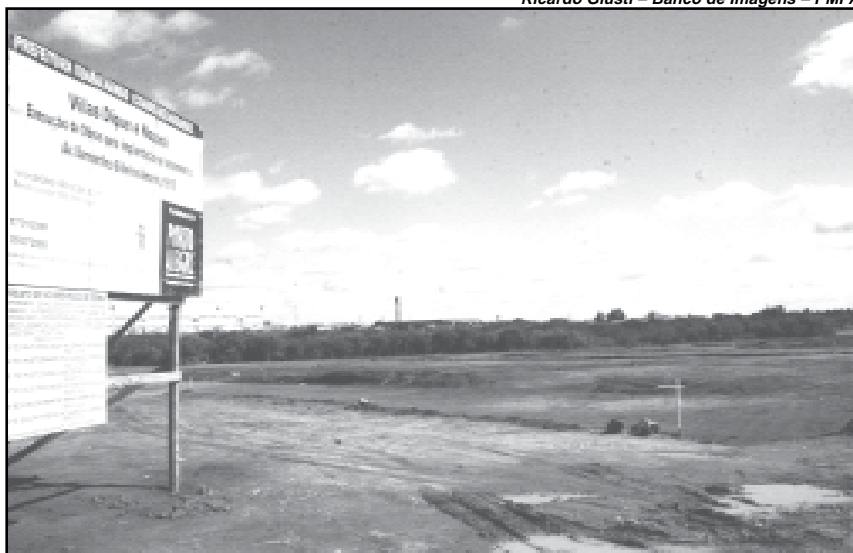
O loteamento está sendo construído pela prefeitura na Zona Norte da Capital