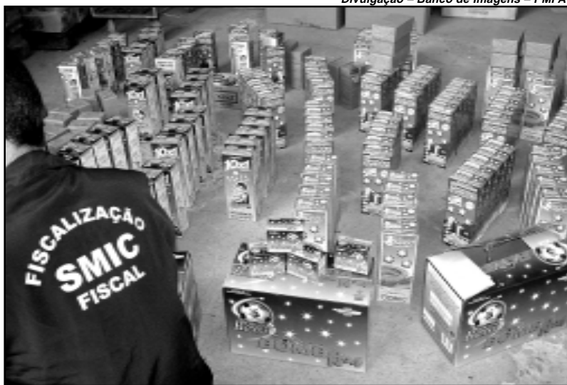
Operação fortalece fiscalização no período das festas juninas

Denúncias de irregularidades podem ser encaminhadas pelo fone 3289-1760 ou pelo e-mail: fiscalizacao@smic.prefpoa.com.br