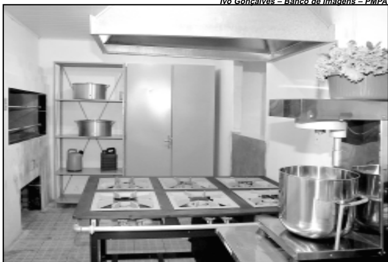
Oito cozinhas já estão implantadas, três projetos estão sendo executados e sete em fase de conclusão

Até o final deste ano, a prefeitura deverá aprovar o projeto de lei que cria o Sistema Municipal de Segurança Alimentar e Nutricional Sustentável, vinculado ao gabinete do prefeito. A intenção do governo é instituir um conselho, com representação comunitária e do poder público. Com a mudança, serão superados os entraves que hoje emperram as ações da prefeitura nessa área. O anteprojeto está em avaliação nas comissões da Câmara Municipal, mas ainda não tem data para entrar em votação.