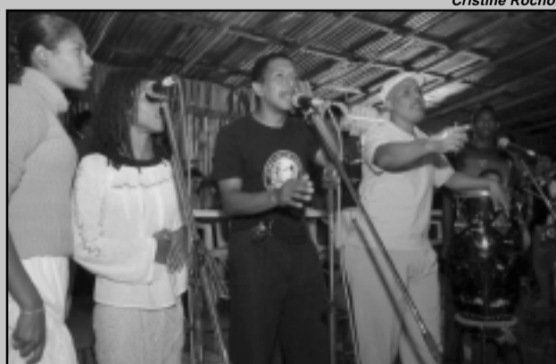
O espaço das plenárias abrigou a diversidade cultural da cidade