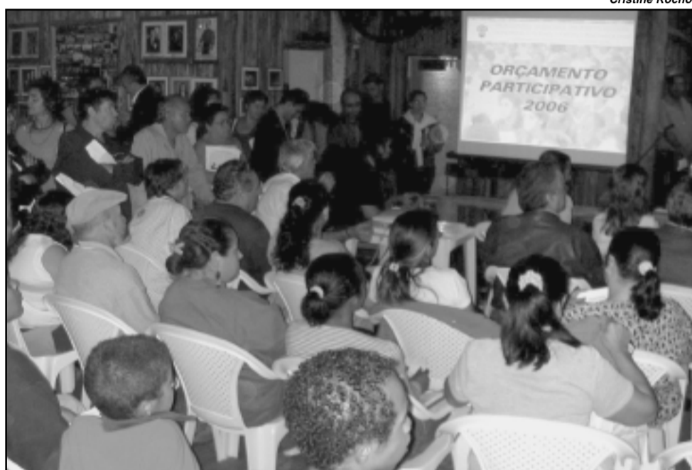
Última plenária do OP registrou 697 credenciados que priorizaram educação