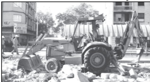
Em 2 de maio de 2005, começam as obras da maior obra de drenagem urbana da cidade