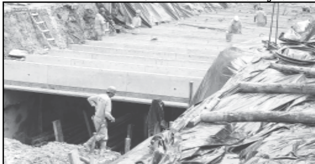
18/10/2007 – Para a execução desta galeria, o DEP fez uma escavação equivalente a um prédio de 2,5 andares