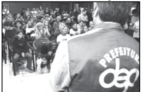
12/5/2006 - O conduto é a primeira obra da cidade a ter acompanhamento direto da assessoria comunitária do DEP, fazendo constantemente a relação da obra com a comunidade