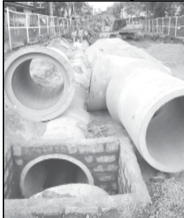
18/10/2007 – 10.850 metros são tubulações de microdrenagem (rede de diâmetro inferior a 1,5 metros)