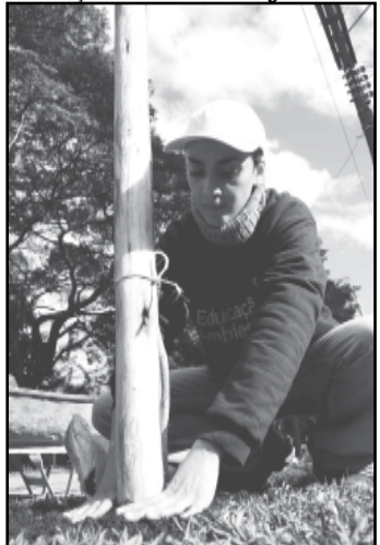
1/8/2006 – A previsão era remover 408 vegetais. Porém foram suprimidas apenas 79. Mesmo assim, novas árvores foram plantadas como compensação ambiental