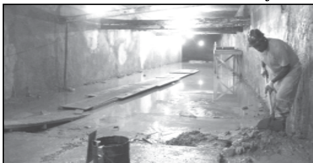
28/10/2007 – Na Rua Cel. Bordini localiza-se a maior galeria do Conduto, com 7,5 metros de largura por 2,5 metros de altura