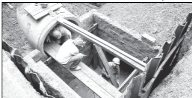
3/11/2006 – Cerca de 3.800 metros de galerias de concreto foram construídas no subsolo