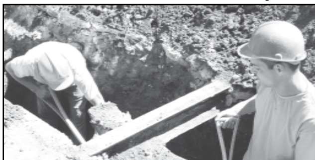
3/11/2005 – O monitoramento arqueológico do conduto recolheu mais de 9 mil peças. A análise desses materiais ajudará a esclarecer a história antiga de Porto Alegre. Aqui, a descoberta dos trilhos da antiga linha do Bonde