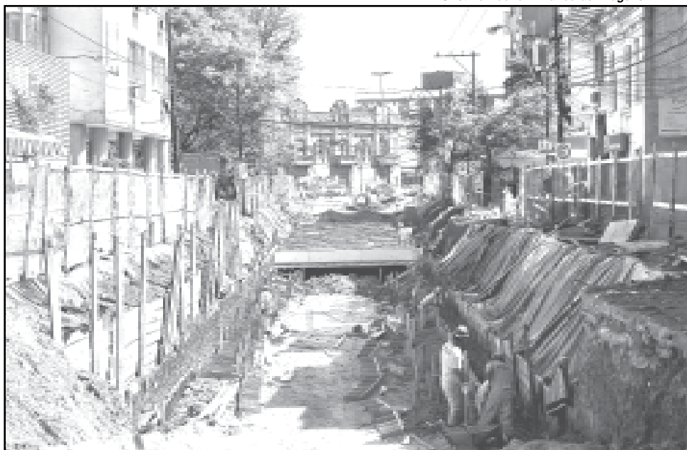
Rua Cel. Bordini 18/10/2007