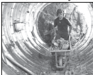
5/9/2007 – Método não-destrutivo utiliza um anel de 2,40 metros numa profundidade de oito metros na travessia da Rua Quintino Bocaiuva, no prolongamento da Rua Eudoro Berlink