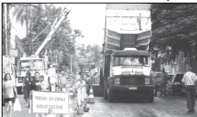
13/3/2008 – Com o asfaltamento da Cel. Bordini chegam ao fim as obras do Conduto Álvaro Chaves-Goethe que será entregue hoje