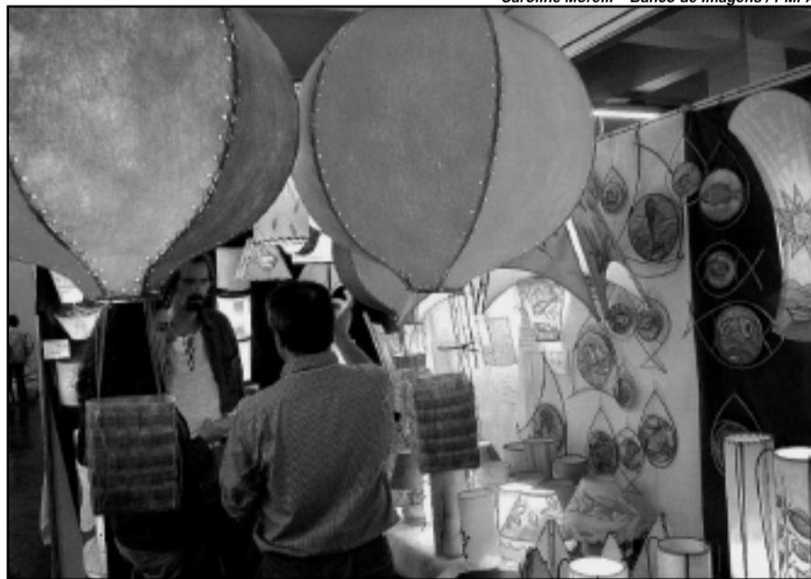
Neste ano, expositores da Argentina, Uruguai e mais 16 estados brasileiros estão presentes em 80 estandes