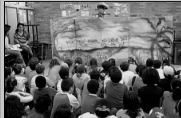
180 alunos da Escola Estadual de Educação Básica Apeles, no Bairro Santana, interagiram com personagens e demonstraram conhecimento sobre as questões ambientais