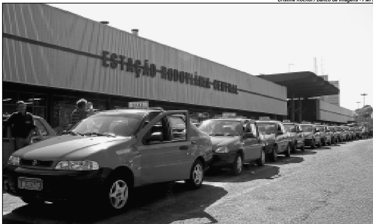
Estão habilitados apenas os veículos com pontos estabelecidos no aeroporto e na rodoviária.