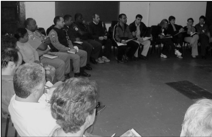
...da Zona Norte discutem causas dos focos de violência