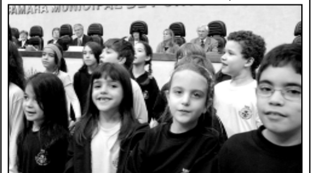
Alunos participaram da homenagem