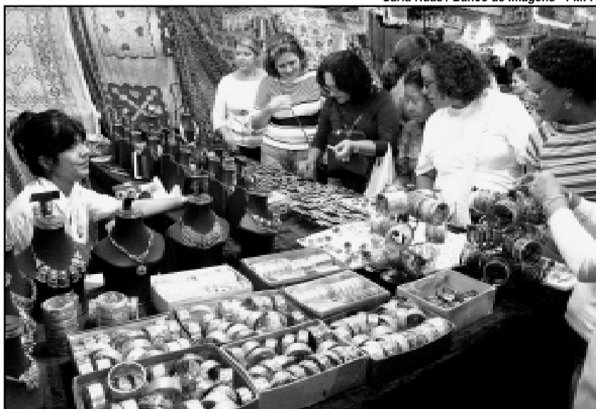
Carla Ruas / Banco de Imagens - PMPA

Até o dia 28 de maio, o público poderá conferir o trabalho de artesãos da Argentina, Bolívia, Equador, Índia, Indonésia, Paquistão, Peru, Quênia, Rússia, Senegal, Tibete, Turquia, Vietnã, Zimbábue entre outros. Serão mais de 800 artesãos apresentando trabalhos de segunda a sexta, das 15h às 22h, sábado, das 14h às 22h, e domingo, das 14h às 21h.