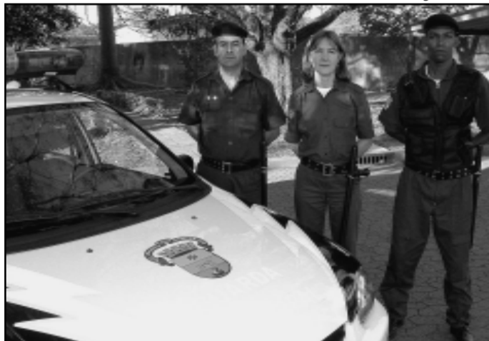
Guarda Municipal será tema do eixo Sistema Único de Segurança Pública