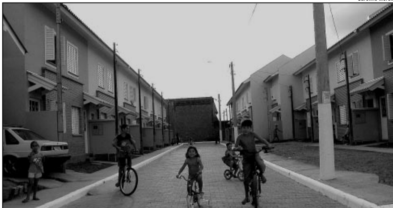
As 222 moradias do Loteamento Progresso são entregues aos novos moradores