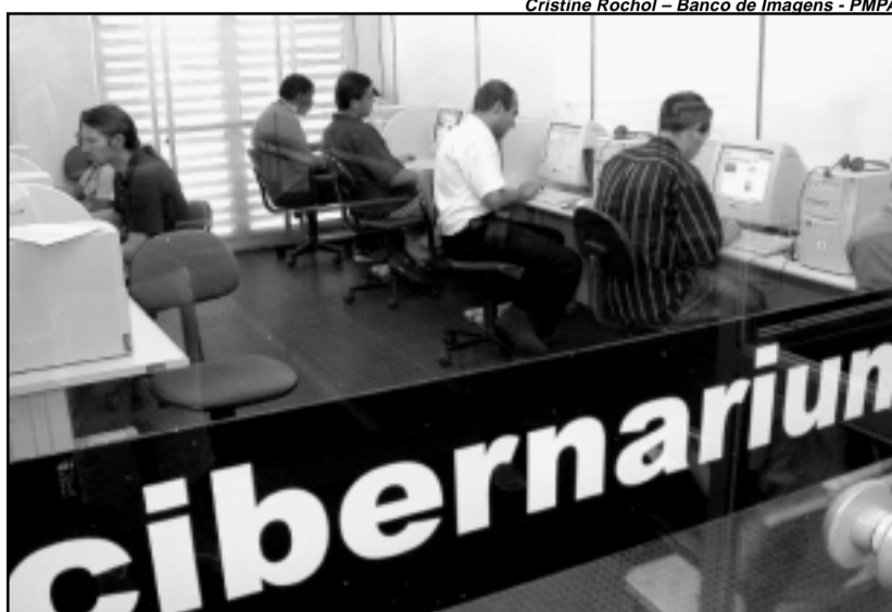
Espaço da Usina do Gasômetro contará com equipamentos e programas acessíveis a cegos

permitir a acessibilidade para cegos ao conjunto dos serviços oferecidos.