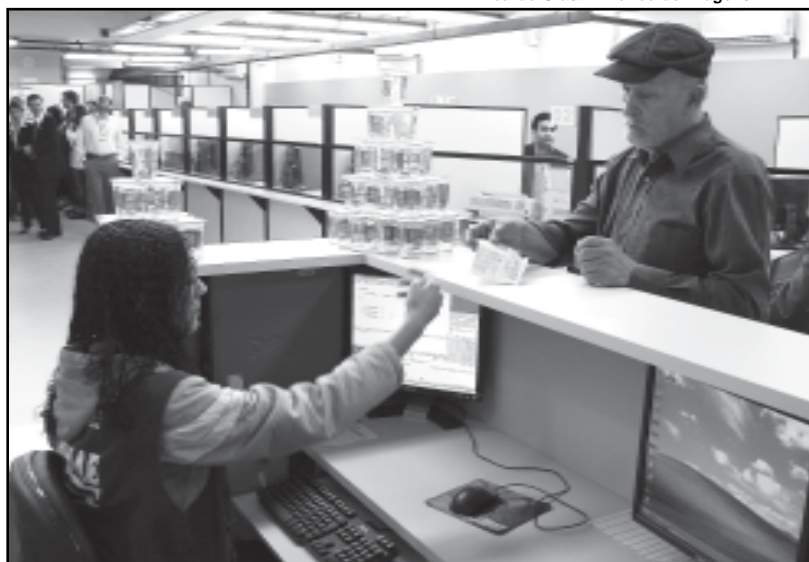
O local estava fechado para reformas desde 24 de agosto

Foram investidos R$ 191 mil na reforma, que faz parte do programa de padronização visual dos cinco postos de atendimento comercial do Dmae. A iniciativa também objetiva proporcionar maior conforto para usuários e servidores, com mobiliário, iluminação