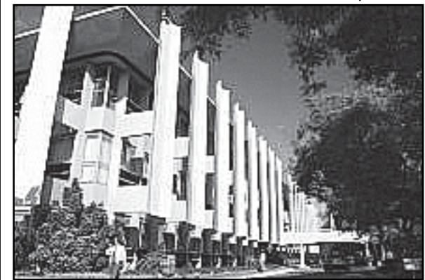
Fachada da Câmara