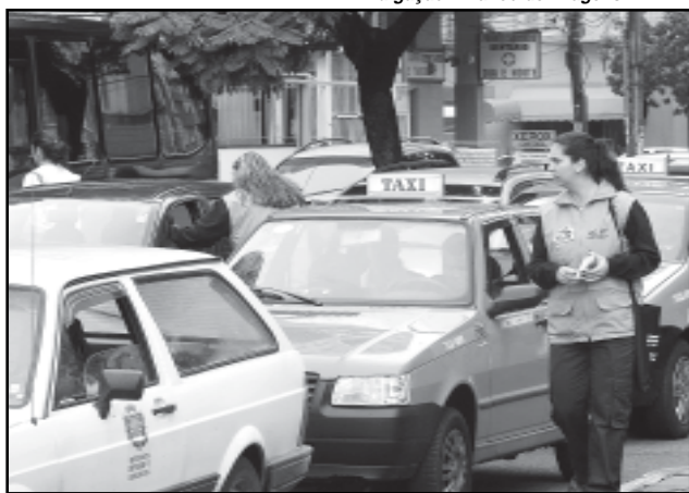
Campanhas educativas da EPTC começam a dar resultados práticos