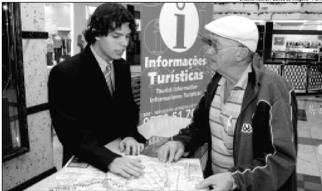
Objetivo é consolidar Porto Alegre como pólo de turismo