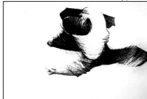
Pessoas em perspectiva do alto