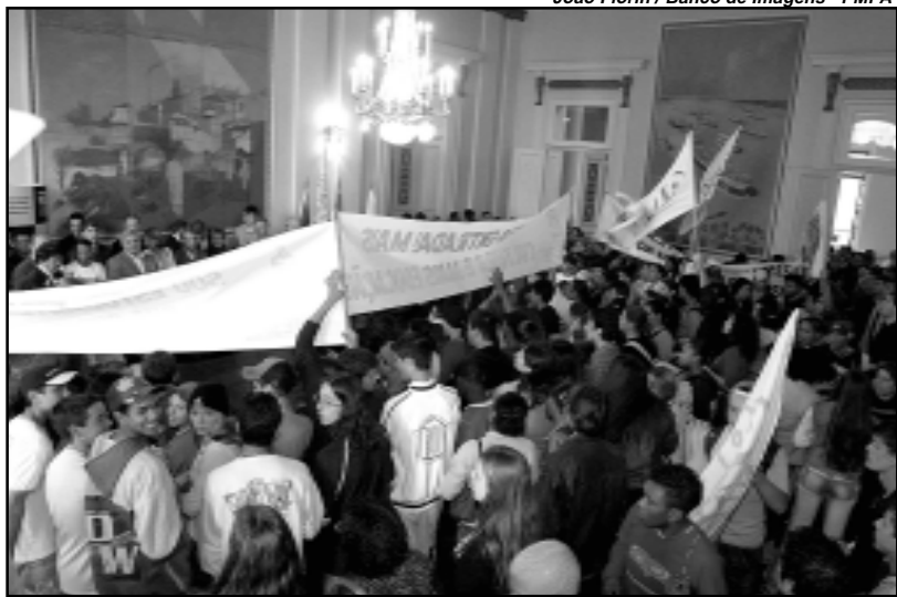
Nova legislação foi sancionada na presença de dezenas de estudantes