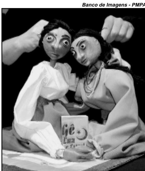
Valor da oficina é um quilo de alimento não-perecível

Quarta-feira, 21, às 19h Sala 502 da Usina do Gasômetro (Avenida Presidente João Goulart, 551) Valor: 1kg de alimento não-perecível Contato: (51) 3212-5979, ramal 238 / usina@smc.prefpoa.com.br