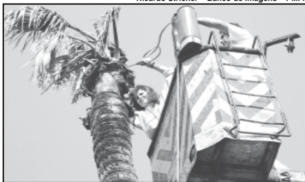
Palmeira, de 25m, recebeu tratamento para o fungo em setembro de 2007

uma camada de 20cm de terra do canteiro onde estão as palmeiras e no local foram colocados 4,5 mil litros de água com tricoderma diluído. Durante 15 dias foi aplicado um composto com o tricoderma em pó, com a terra nova e, após, adubo organomineral na base da palmeira.