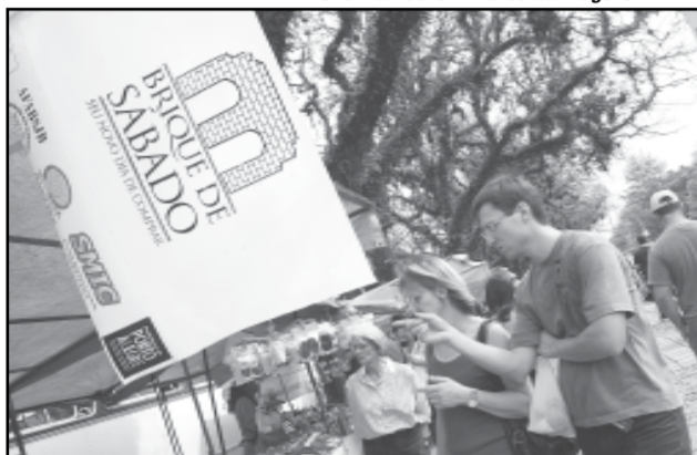
O Brique de Sábado é considerado a maior feira de artesanato a céu aberto do sul do país, com mais de 400 expositores

Em setembro de 2007, servidores da Smam desenvolveram uma ação especial para tentar recuperar a palmeira da califórnia ( Washingtonia filifera ), plantada na década de 40. Com auxílio de um caminhão-cesto, que eleva os técnicos até o topo do vegetal, de cerca de 25 metros de altura, foi aplicado um produto ( micoparásita trichoderma ) diretamente nas folhas, após a remoção das folhas secas. Também foi removida