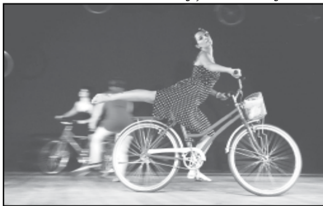
Bailarinos utilizam repertório dos filmes de Fellini como inspiração

Hoje, amanhã e domingo, às 20h Teatro Renascença (Avenida Érico Veríssimo, 307 — Menino Deus) Ingressos a R$ 15 (na hora)