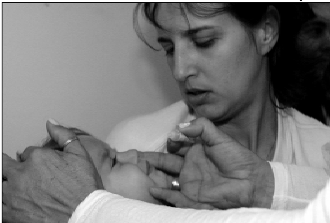
Foram imunizadas 84.504 crianças de zero a cinco anos