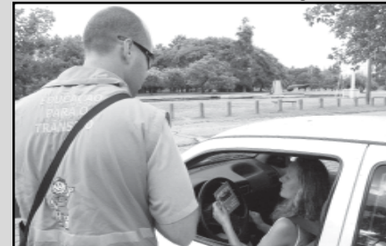
Campanhas educativas serão intensificadas no mês de dezembro