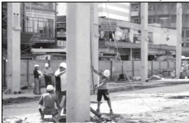
A instalação da estrutura é montada através de um processo de engenharia de pré-moldados de alta tecnologia

Com o ritmo que a obra vem sendo executada, a expectativa de conclusão é para maio do próximo ano e vai proporcionar aos comerciantes informais melhores condições de trabalho e renda, além de contribuir com a revitalização do Centro. “É uma solução de caráter definitivo, que vai dar aos camelôs um espaço legalizado, com endereço, identidade e condições