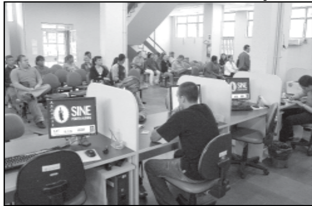
Foram captadas 2.569 desde o início das operações municipalizadas