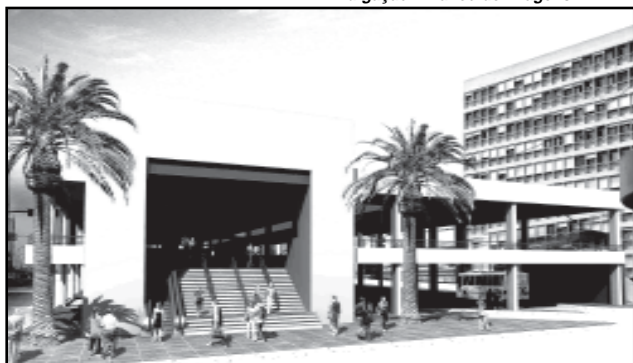
A expectativa de conclusão das obras é para maio de 2008